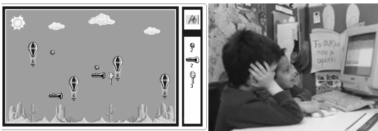
Εικόνα 1. Η αρχική διαμόρφωση του γρίφου που καλούνται να επιλύσουν τα παιδιά συνεργατικά και στιγμιότυπο της διαδικασίας (δεξιά).

Η διάρκεια κάθε συνεδρίας, ήταν 30 λεπτά. Αρχικά, καλωσορίστηκαν και έγινε συνοπτική εισαγωγή στο θέμα στο παζλ που έπρεπε να λύσουν και στο παιχνίδι. Στα παιδιά, δόθηκε ένας υπολογιστής και αφέθηκαν να επιλέξουν πως θα παίξουν και ποια θέση θα πάρουν μπροστά στον υπολογιστή (Εικόνα 1, δεξιά). Ενθαρρύνθηκαν να εκφραστούν ελεύθερα και να συνεργαστούν όπως αυτά επιθυμούσαν. Όταν πήραν μια θέση στον υπολογιστή, εκκινήσαμε το λογισμικό στη δραστηριότητα που επιλέξαμε να δώσουμε στα παιδιά προς επίλυση. Δημιουργήσαμε μία δραστηριότητα με θέμα τα αερόστατα. Στην Εικόνα 1, φαίνεται η αρχική διαμόρφωση του παζλ, όπου στόχος είναι όλα τα αερόστατα να πετάξουν ψηλά. Εξηγήσαμε στα παιδιά ότι τα τέσσερα αερόστατα έχουν να κάνουν ένα πολύ μακρινό ταξίδι αλλά δεν μπορούν όλα να ξεκινήσουν. Αναφέρθηκε ότι μόνο ένα από τα τέσσερα αερόστατα μπορεί να πετάξει από μόνο του, ενώ για τα άλλα τρία είναι απαραίτητη η βοήθειά τους ώστε όλα μαζί να ξεκινήσουν το μακρινό τους ταξίδι.