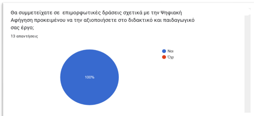
Γράφημα 3: Πιθανότητα συμμετοχής σε επιμορφωτικές δράσεις για την Ψηφιακή Αφήγηση

Στο γράφημα 3 απεικονίζεται η καθολική προθυμία των συμμετεχόντων να επιμορφωθούν περαιτέρω στην Ψ.Α. προκειμένου να βελτιώσουν το παιδαγωγικό και διδακτικό τους έργο.