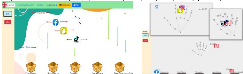
Εικόνες 1 & 2: Το “SorBET” σε λειτουργία Παιχνιδιού / κλασική (1) & ανανεωμένη (2) εκδοχή

κατάλληλη κατηγορία, από τον παίκτη, ο οποίος εκτελεί το ρόλο του «χειριστή», δίνοντας την ευκαιρία μόνο σε ένα παίκτη τη φορά να αλληλεπιδρά άμεσα με το εργαλείο (Εικόνα 1).