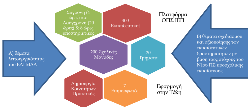
Σχήμα 1: Σχήμα Επιμόρφωσης

Παράλληλα με την ανάπτυξη των προαναφερθέντων ψηφιακών μαθησιακών αντικειμένων, σχεδιάστηκε και εφαρμόστηκε ένα πλήρες και συνεκτικό πρόγραμμα εξ αποστάσεως επιμόρφωσης με σύγχρονες συνεδρίες και ασύγχρονες δραστηριότητες το οποίο αφορούσε 200 περίπου σχολικές μονάδες νηπιαγωγείου (590 εκπαιδευτικοί κλάδου ΠΕ60), οι οποίες επιλέχθηκαν με τυχαία δειγματοληψία από το ΙΕΠ. Οι εκπαιδευτικοί των μονάδων αυτών επιμορφώθηκαν στην εκπαιδευτική χρήση των μαθησιακών αντικειμένων και των συναφών σεναρίων με κατάλληλες συσκευές (ταμπλέτες, διαδραστικοί πίνακες, κλπ.) και το εφάρμοσαν στην τάξη τους, με ένα εξ αποστάσεως πρόγραμμα διάρκειας δύο (2) μηνών που περιλάμβανε είκοσι τέσσερις (24) ώρες εκπαίδευσης (3 ώρες σύγχρονης και 20 ώρες ασύγχρονης εκπαίδευσης) και οκτώ (8) ώρες σύγχρονης υποστήριξης της πιλοτικής εφαρμογής στην τάξη.